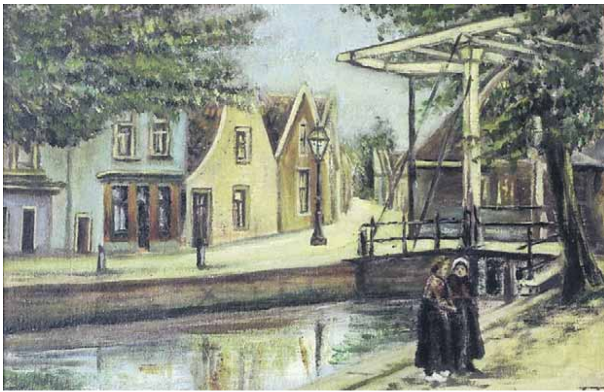
J.J. Tol, Langevaarbrug en Dubbelebuurt, ± 1905 . Olieverf op karton, particulier bezit.

Voor kinderen van de basisschool zijn er de cursussen weerbaarheid,