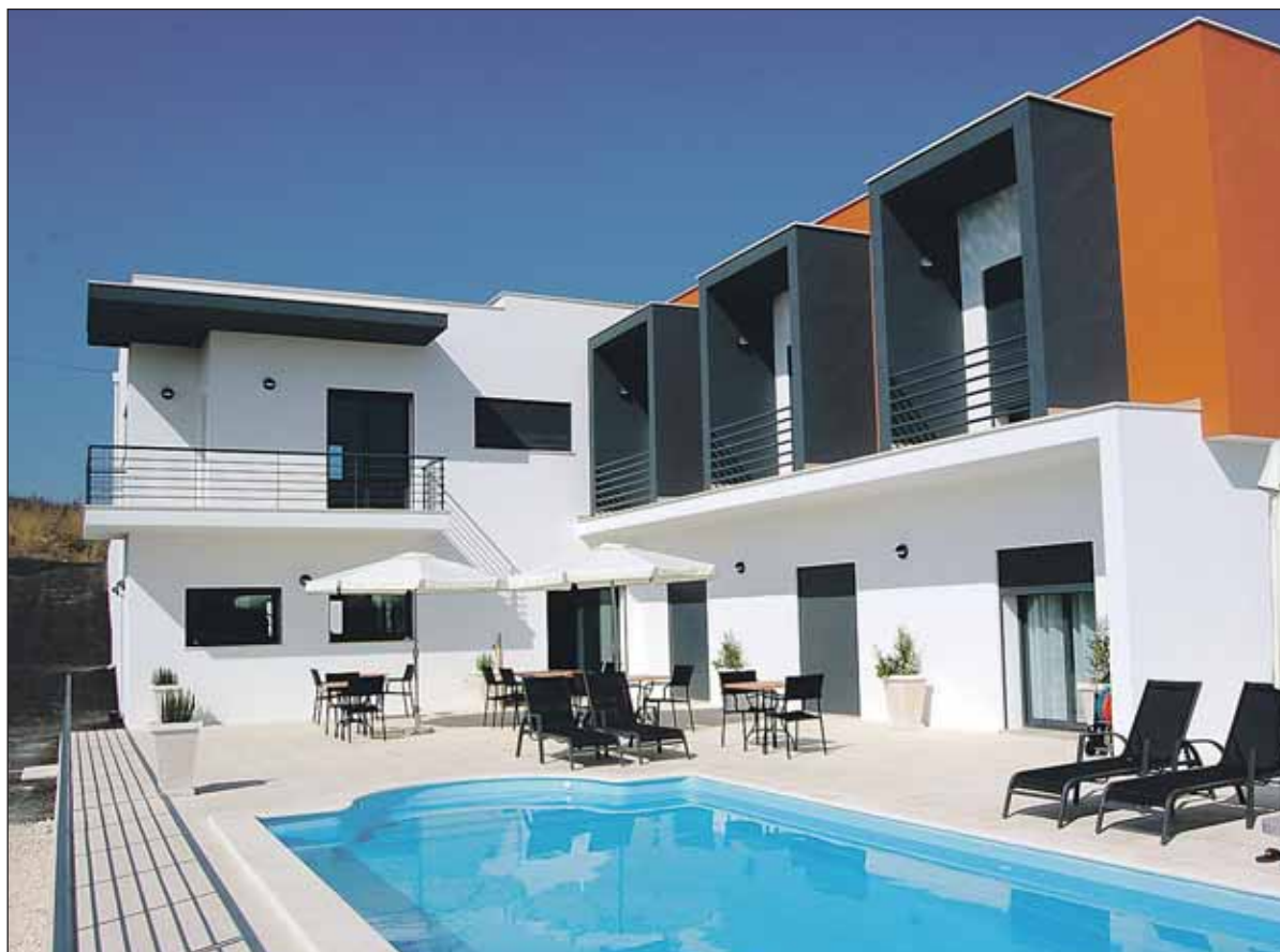
Casa Ceedina met het zwembad. (Foto: pr).

De ontvangst en de verzorging in Casa Ceedina was hartelijk en persoonlijk. Het is ons in ieder geval zo goed bevallen dat we in mei 2011 nog een keer op herhaling gaan.